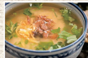
へしこあんかけ粥