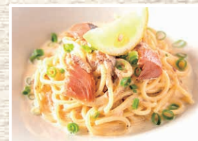
へしこレモンクリーム鯖パスタ